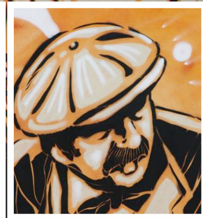
DÉTAILS DE L'ŒUVRE "LA PARTIE DE PÉTANQUE", RÉALISÉE PAR SUFYR (ALEXANDRE PLAUT), JUIN 2017