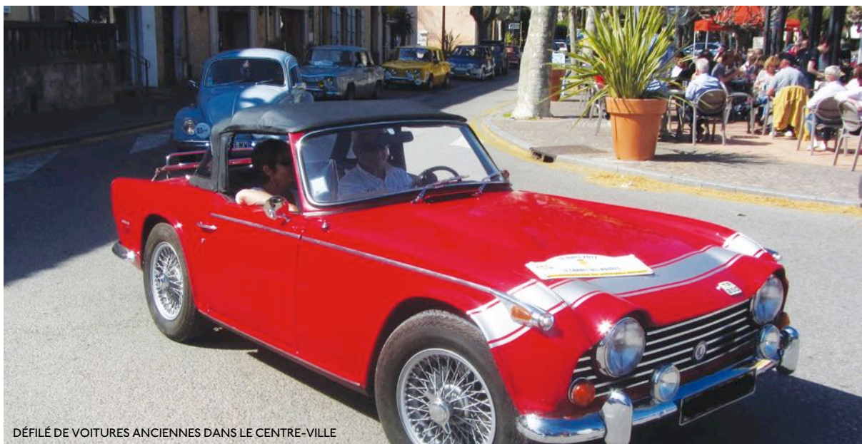
DÉFILÉ DE VOITURES ANCIENNES DANS LE CENTRE-VILLE