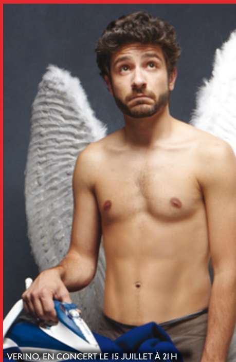
VERINO, EN CONCERT LE 15 JUILLET À 21H