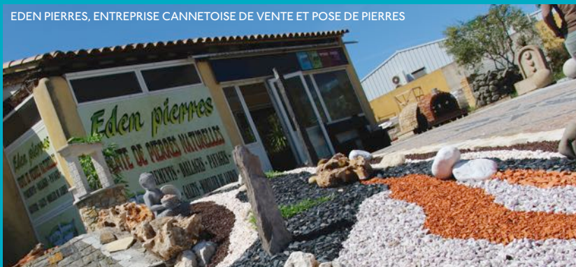
EDEN PIERRES, ENTREPRISE CANNETOISE DE VENTE ET POSE DE PIERRES

La CMAR nous a également mis en relation avec certains de leurs partenaires afin de nous aider à financer nos projets. Enfin, nous avons prévu de participer à l'une des formations proposées par la CMAR afin de développer nos compétences et d'avoir des bases plus solides dans nos projets de développement.