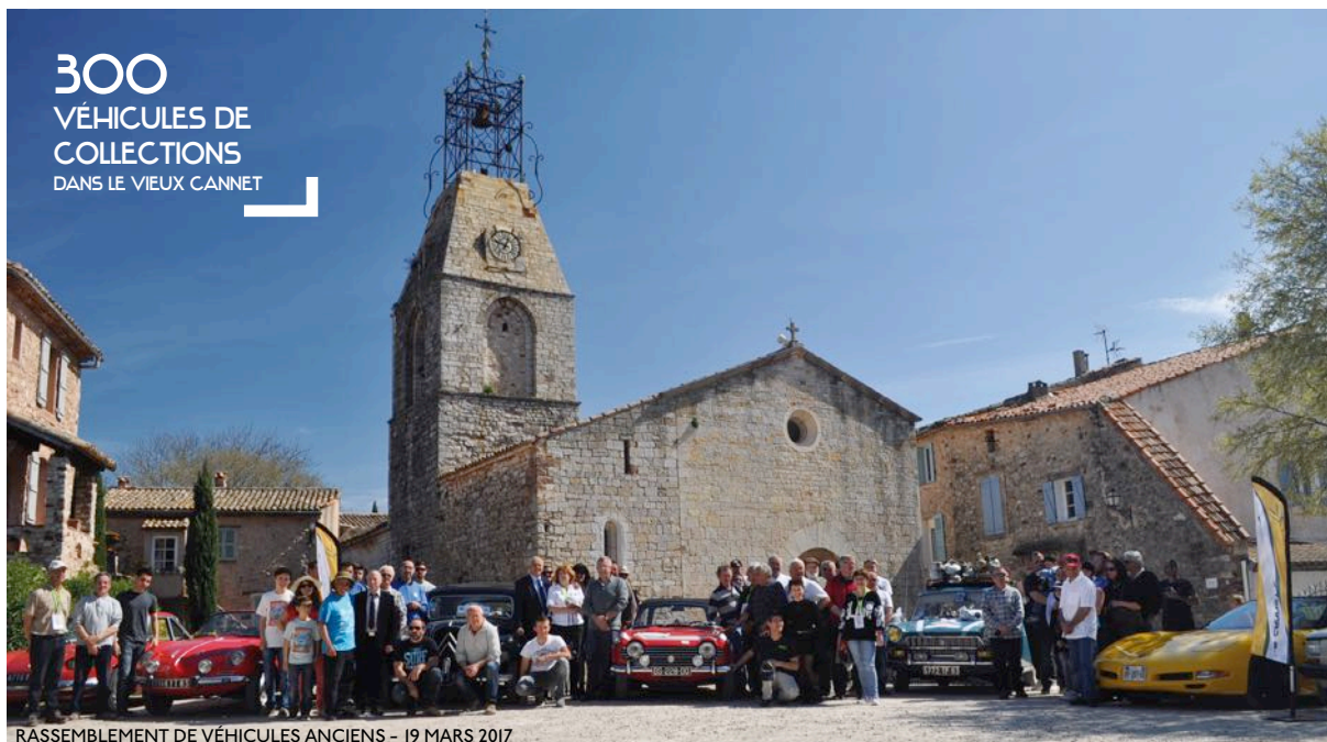
RASSEMBLEMENT DE VÉHICULES ANCIENS - 19 MARS 2017

300 VÉHICULES DE COLLECTIONS DANS LE VIEUX CANNET