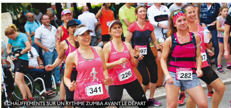
ÉCHAUFFEMENTS SUR UN RYTHME ZUMBA AVANT LE DÉPART