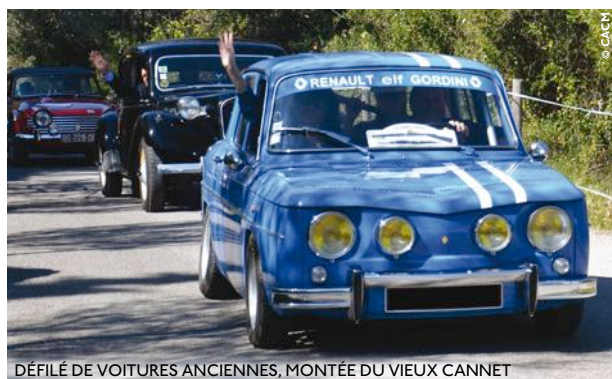
DÉFILÉ DE VOITURES ANCIENNES, MONTÉE DU VIEUX CANNET

Une expérience à renouveler le 19 novembre 2017 , lors du prochain rassemblement !