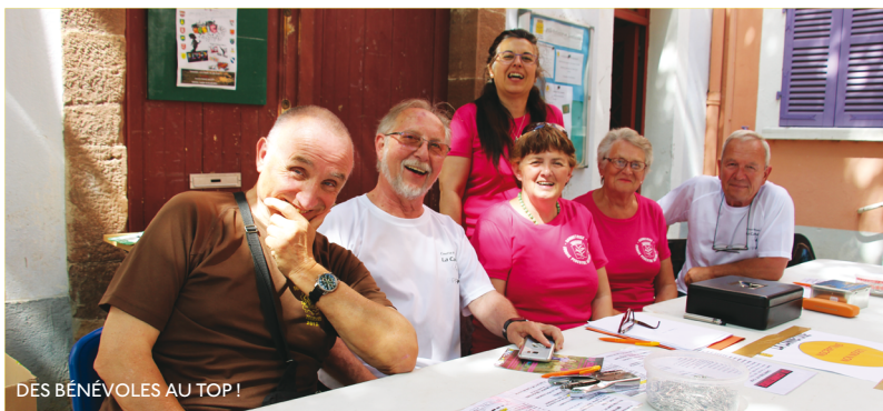
DES BÉNÉVOLES AU TOP !