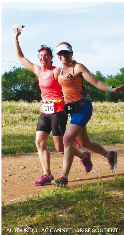
AUTOUR DU LAC CANNETI, ON SE SOUTIENT !